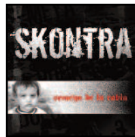
Semeya de la rabia (autoedición, 2006)