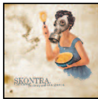
Cantares pa dempués d'una guerra (autoedición, 2008)