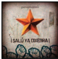
¡Salú ya Dixebra! (L'Aguañaz, 2008)