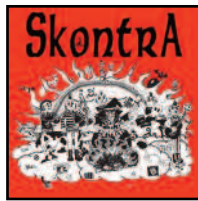
Maqueta (autoedición, 2003)