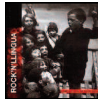
Rock 'n' Llingua (L'Aguañaz, 2004)