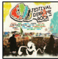
Derrame Rock al rojo vivo (Santa Grial, 2006)