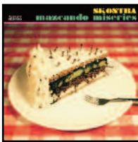
Mazcando miserias (autoedición, 2010)